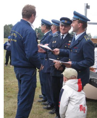
Velitel mužského družstva při přebírání ceny