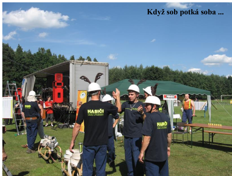
Když sob potká soba ...

spřežení prokličkovalo mezi fáborky, poté soutěžící z kádě museli vylovit rybičky a začal útok, kdy protáhli hadice ledovým tunelem. Na závěr se celé družstvo muselo posadit ke stolu a každý vypil panáka vaječného koňaku. V této části soutěže jsme byli pátí.