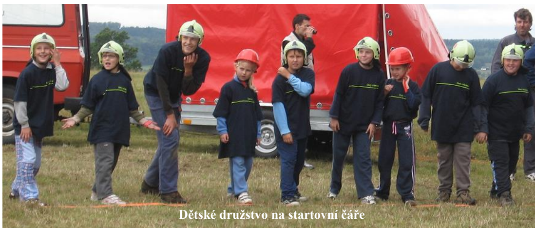
Dětské družstvo na startovní čáře

Hasičská soutěž - VII. ročník „O HORECKÝ POHÁR“: Osmého září 2007 se konala v Kosteleckých Horkách hasičská soutěž, které se zúčastnilo družstvo dětí i mužů. Počasí bylo chladné a chvilkami i poprchávalo. Děti se ve své kategorii umístily na čtvrtém místě z osmi družstev. Muži dopadli o něco hůře díky zradě techniky (na mašině prasklo lanko od plynu), ale útok přeci jen dokončili a umístili se na desátém místě. V kategorii mužů soutěžilo celkem třináct družstev.